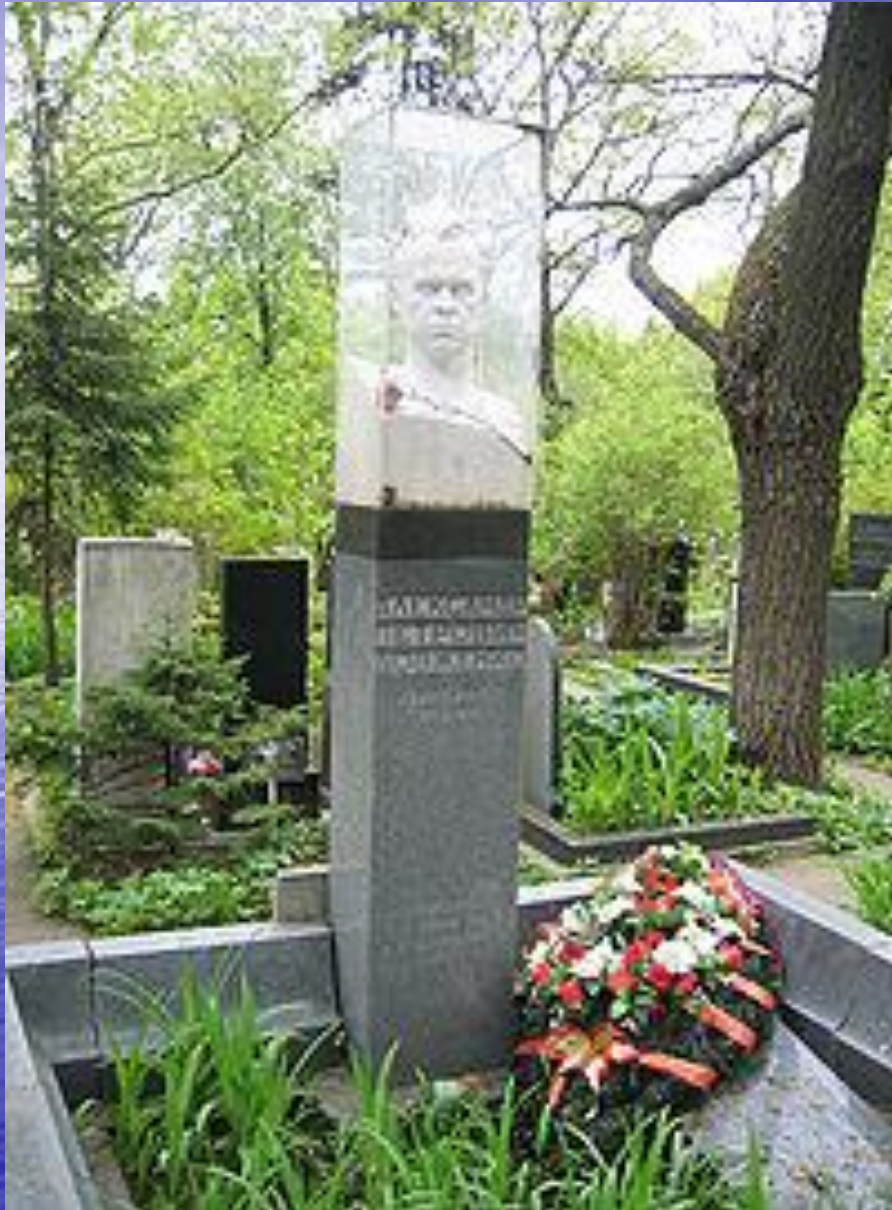
Могила О.П. Довженка у Москві. Новодівичий цвинтар