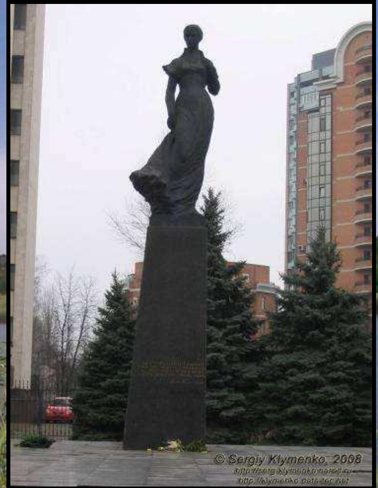
Пам'ятник у Києві