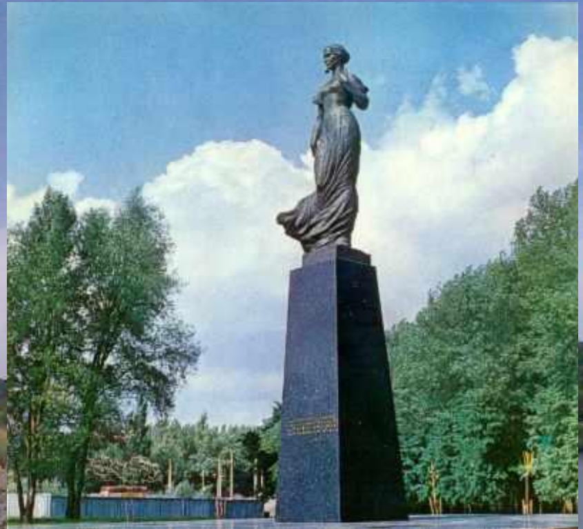
Пам'ятник Лесі Українці в Києві (площа Лесі Українки). Скульптор Г.Н.Кальченко, архітектор А.Ф.Ігнащенко. Встановлено в 1973 р.