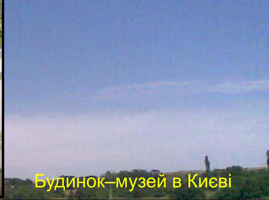
Будинок-музей в Києві