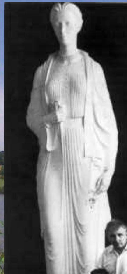
Пам'ятник Лесі Українки у Торонто