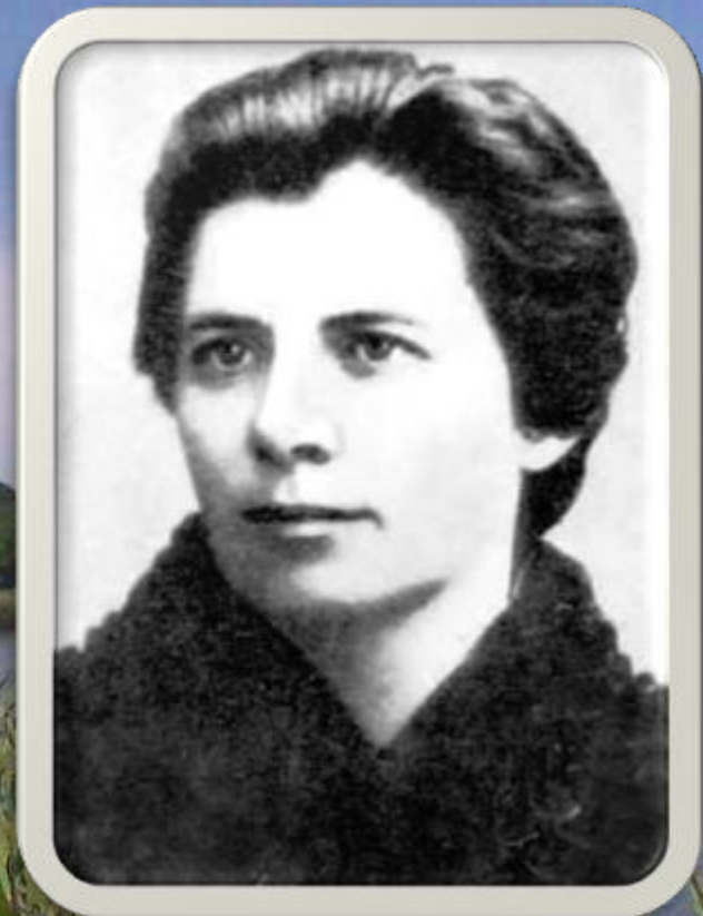
Ольга Косач – мати Лесі Українки. Псевдонім Олена Пчілка