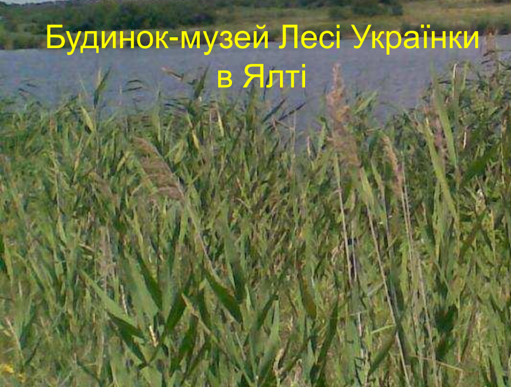
Будинок-музей Лесі Українки в Ялті