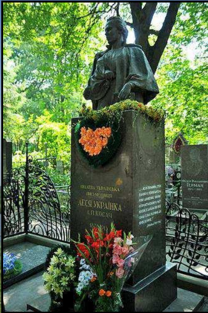
Могила Лесі Українки