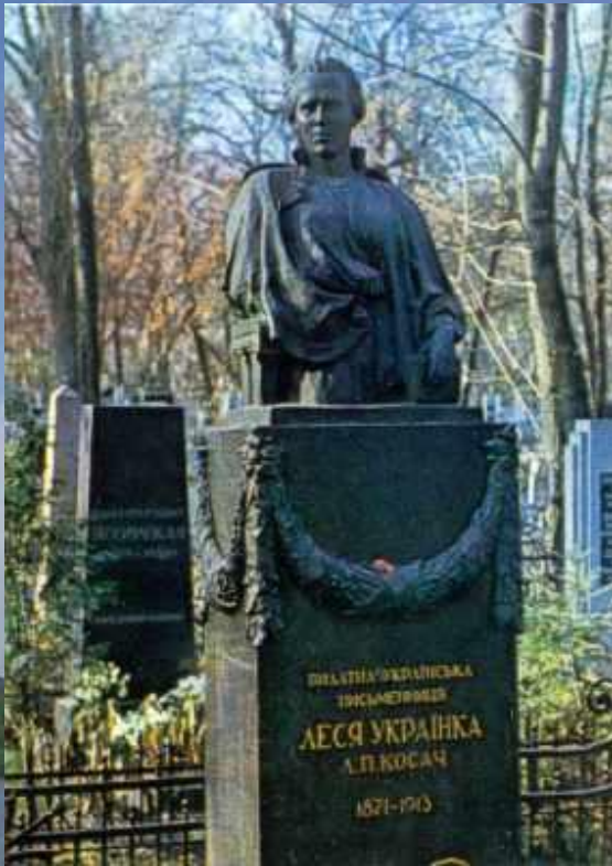
Пам'ятник на могилі Лесі Українки на Байковому кладовищі в Києві. Скульптор Г.Л.Петрашевич. Встановлено в 1939 р.