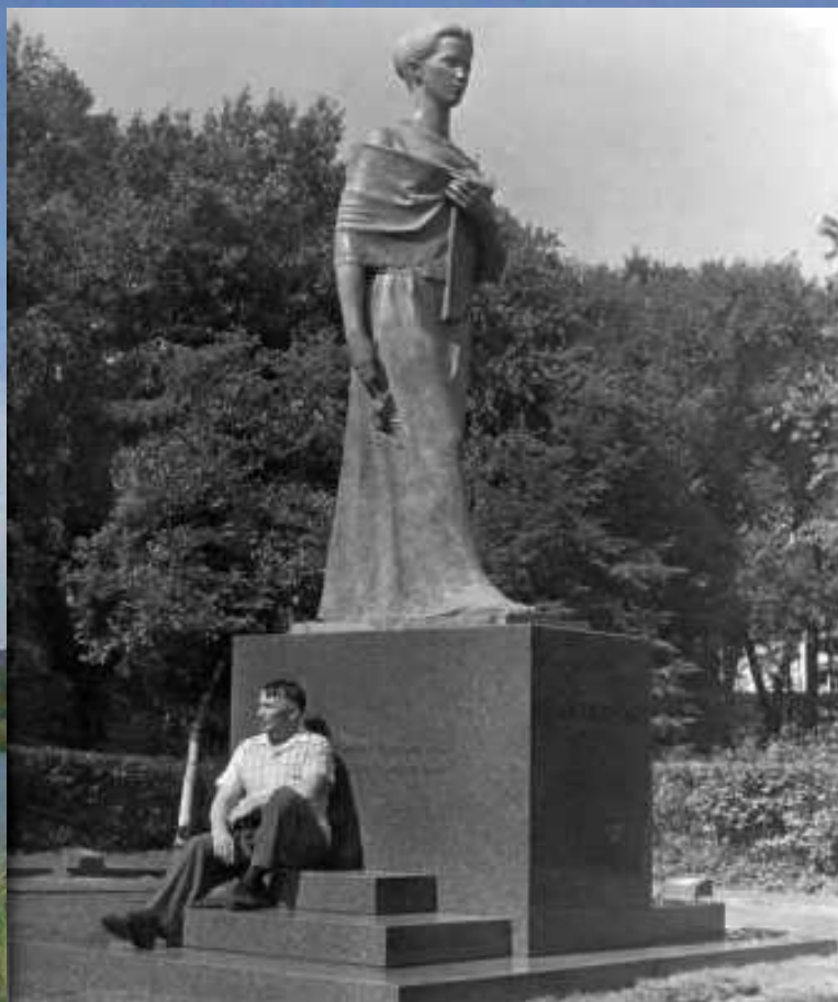
Пам'ятник Лесі Українки у Клівленді